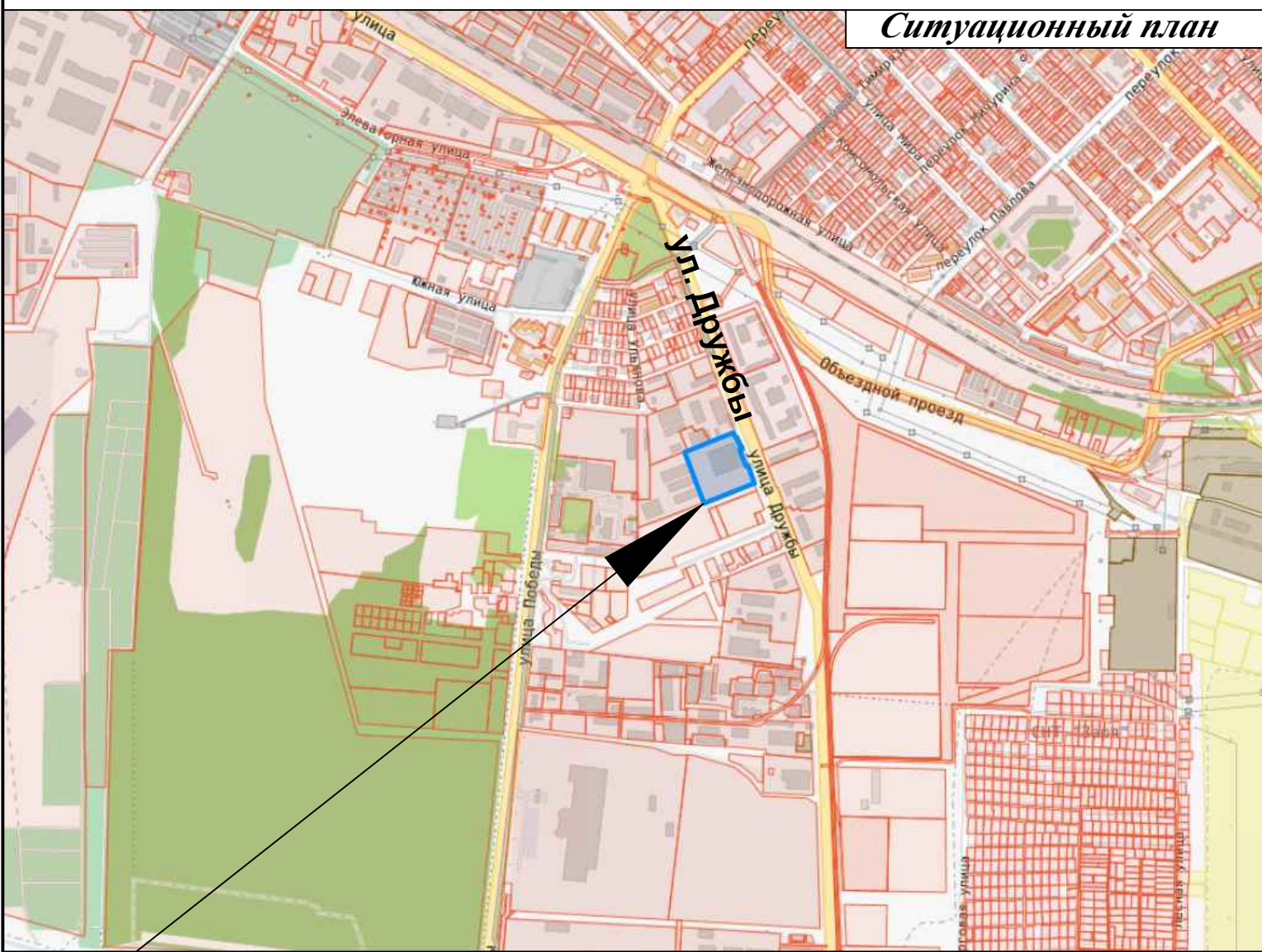
Схема границ формируемого земельного участка ЗУ 2 на актуальной кадастровой карте