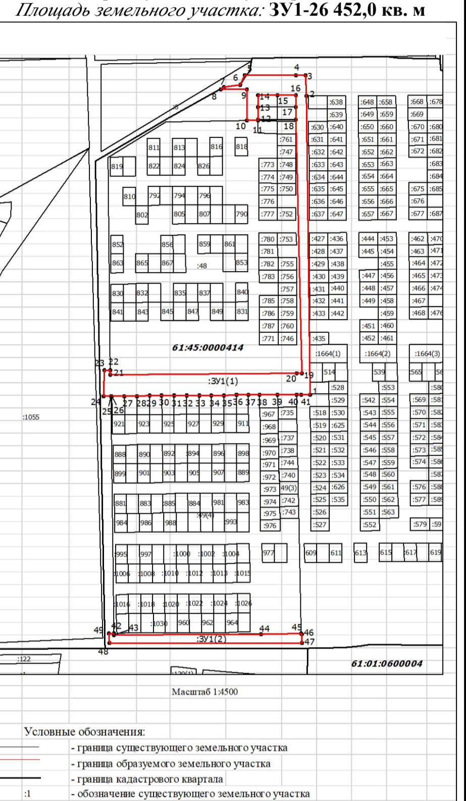
Схема границ образуемого земельного участка ЗУ 1 Ростовская обл., г. Азов, пер. Паустовского, ул. Заречного Площадь земельного участка: ЗУ1-26 452,0 кв. м

Каталог координат образуемого земельного участка ЗУ 2 Ростовская обл., г. Азов, пер. Паустовского, ул. Заречного Площадь земельного участка: ЗУ2-32 221,0 кв. м